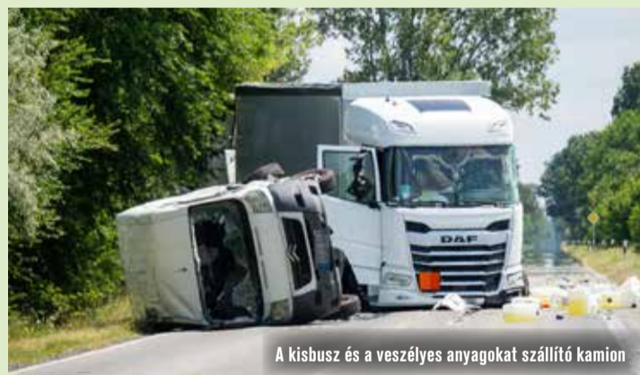
A kisbusz és a veszélyes anyagokat szállító kamion

A műszaki mentés a folyamatosan keletkező életveszélyes mérges gázok miatt éjjelig tartott. A tűzoltók csak speciális védőfelszerelés használatával tudták megközelíteni a roncsokat és elvégezni a veszélyes anyagok mentesítését és semlegesítését. A helyszíni szemle és műszaki mentés idejére teljes útlezárás volt érvényben. A rendőrök a forgalmat Szabadszállás és Fülöpháza felé terelték.