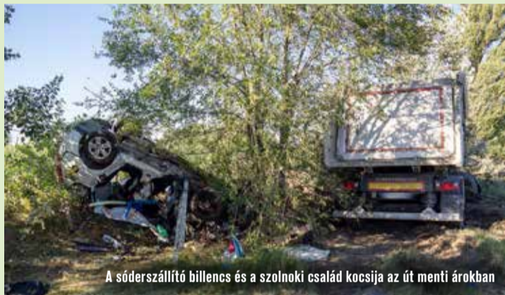
A sóderszállító billencs és a szolnoki család kocsija az út menti árokban

Több teherautó, kamion, köztük egy veszélyes anyagokat szállító jármű, egy kisbusz és két személyautó ütközött össze július 4-én reggel Izsák térségében, az 52 főúton. A tragikus balesetnek egy épp nyaralni induló szolnoki család is részese volt, sajnos a személyautó sofőrje életét veszítette, miután autójukat letarolta egy rakott teherkocsi. A sok sérült közül többen a kiömlő mérgező anyagok miatt kerültek kórházba.