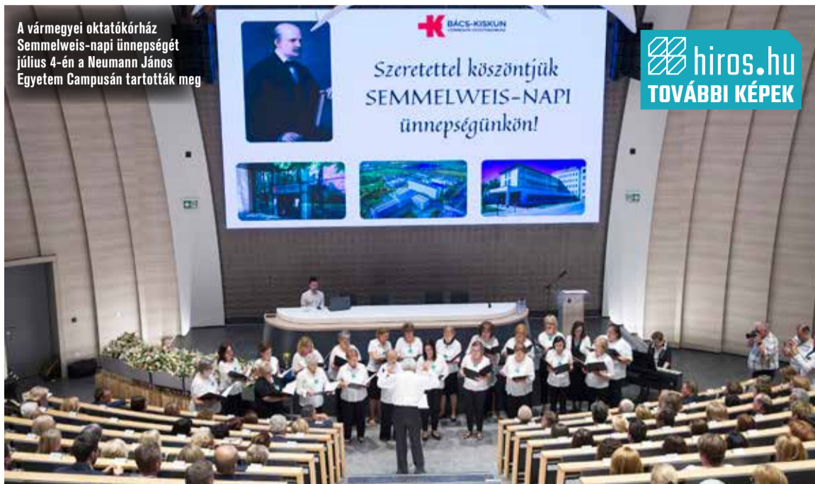
A vármegyei oktatókórház Semmelweis-napi ünnepségét július 4-én a Neumann János Egyetem Campusán tartották meg