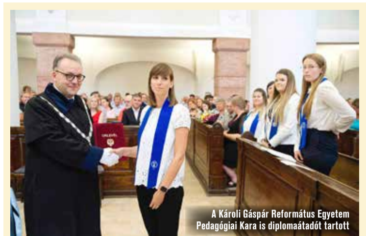
A Károli Gáspár Református Egyetem Pedagógiai Kara is diplomaátadót tartott