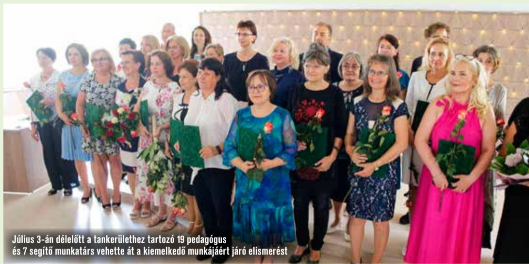
Július 3-án délelőtt a tankerülethez tartozó 19 pedagógus és 7 segítő munkatárs vehette át a kiemelkedő munkájáért járó elismerést

Minden évben ünnepélyes keretek között nyújtja át a Kecskeméti Tankerületi Központ az év pedagógusainak, valamint az év nevelő-oktató munkát segítő munkatársainak járó díjakat. Július 3-án délelőtt 19 pedagógus és 7 segítő munkatárs vehette át a kiemelkedő munkájáért járó elismerést a Homokszem utcai Tudósház nagytermében megtartott tanévzáró ünnepségen.