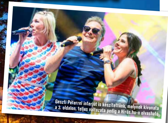
Geszti Péterrel interjút is készítettünk, melynek kivonata a 3. oldalon, teljes változata pedig a Hírös.hu-n olvasható