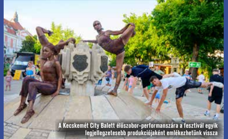
A Kecskemét City Balett előszobor-performanszára a fesztivál egyik legjellegzetesebb produkciójaként emlékezhetünk vissza