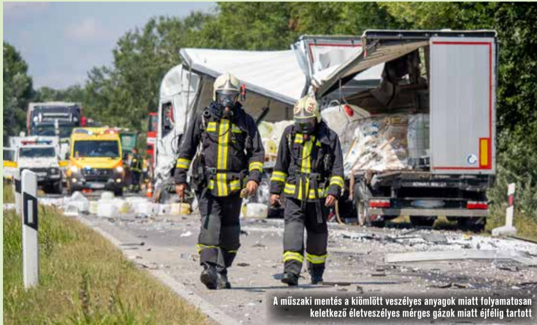
A műszaki mentés a kiömlött veszélyes anyagok miatt folyamatosan keletkező életveszélyes mérges gázok miatt éjjelig tartott

Több teherautó, kamion, köztük egy veszélyes anyagokat szállító jármű, egy kisbusz és két személyautó ütközött össze július 4-én reggel Izsák térségében, az 52 főúton. A tragikus balesetnek egy épp nyaralni induló szolnoki család is részese volt, sajnos a személyautó sofőrje életét veszítette, miután autójukat letarolta egy rakott teherkocsi. A sok sérült közül többen a kiömlő mérgező anyagok miatt kerültek kórházba.