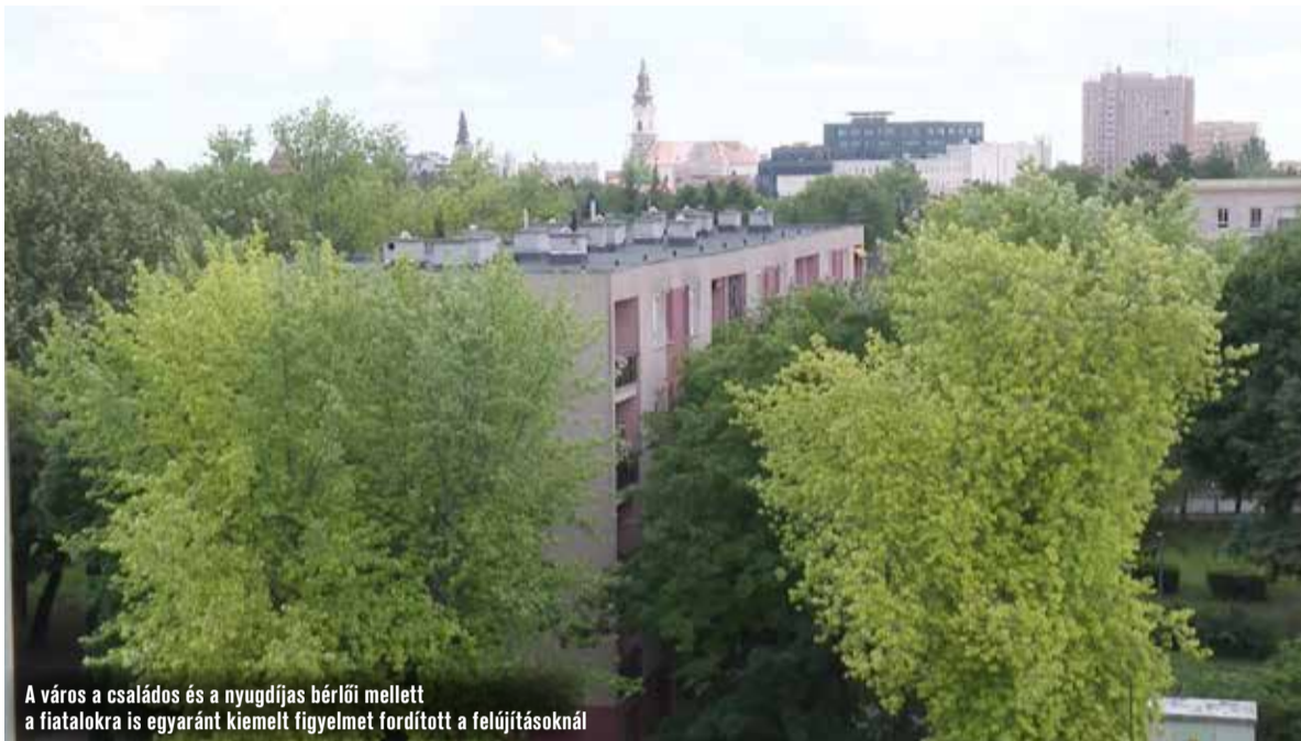
A város a családós és a nyugdíjas bérlői mellett a fiatalokra is egyaránt kiemelt figyelmet fordított a felújításoknál

Mint elmondta, kiemelt figyelmet fordítottak a Horváth Döme körüli nyugdíjasházban található leromlott állapotú lakások felújítására is. Ebben a tömbházban kilenc lakás már teljesen elkészült, de hamarosan átadhatják a tizediket is. Erre a projektre összesen több mint 35 millió forintot fordítottak.