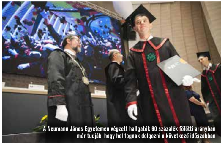
A Neumann János Egyetemen végzett hallgatók 60 százaléka fölötti arányban már tudja, hogy hol fogna dolgozni a következő időszakban