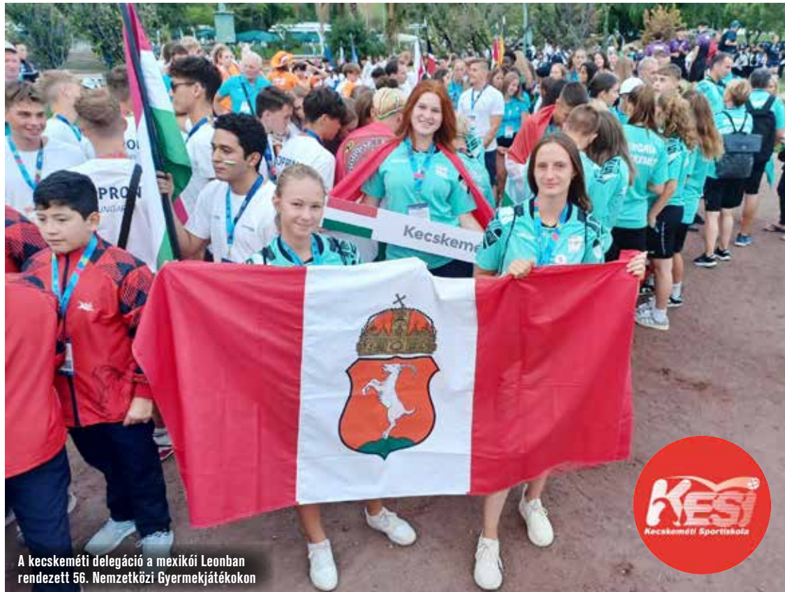
A kecskeméti delegáció a mexikói Leonban rendezett 56. Nemzetközi Gyermejjátékokon