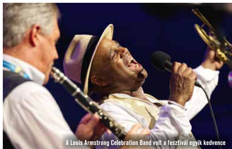
A Louis Armstrong Celebration Band volt a fesztivál egyik kedvence

Szombaton délelőtt rendezték meg a hagyományos JAZZFŐVÁROS futást, éjjel pedig fáklyafényben sárkányhajókkal szállhattak vízre a fesztiválzóók. Vasárnap zárult a koncertáradat, aznap rendezték meg a már elmaradhatatlan fesztiválprogramot, az Oh Yeah Day Ordbáló Versenyt Louis Armstrong előtt tisztelegve.