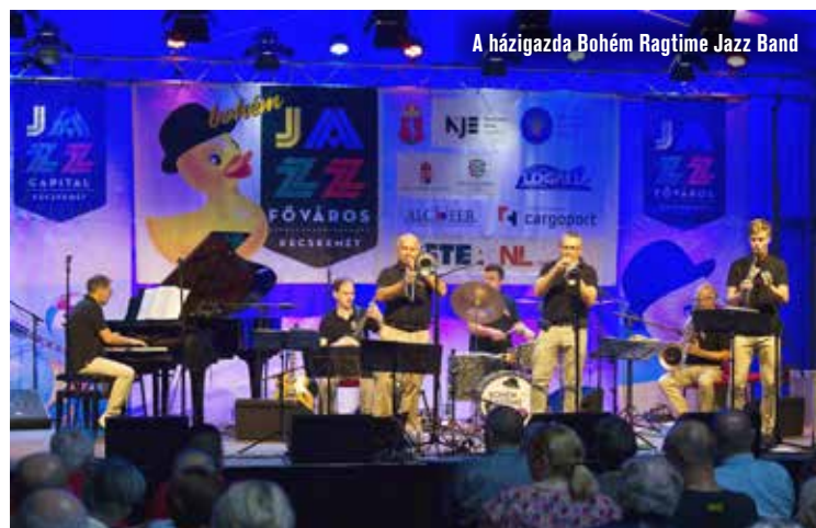
A házigazda Bohém Ragtime Jazz Band