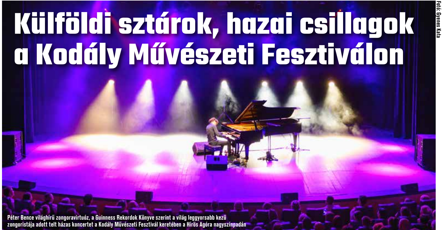
Péter Bence világhírű zongoravirtuóz, a Guinness Rekordok Könyve szerint a világ leggyorsabb kezű zongoristája adott telt házas koncertet a Kodály Művészeti Fesztivál keretében a Hírös Agóra nagyszínpadán

Másnap, július 23-án este a Kodály Spicy Jazz zenekar adott koncertet a Romkertben. Az együttes Kodály Zoltán halálának 50. évfordulója tiszteletére 2017-ben indította útjára zenei projektjét a céllal, hogy az iskolai énekórákról és kóruspróbákról jól ismert magyar népdalok friss, kreatív és lendületes megközelítésben ismét eljussanak a közönséghez, elsősorban a fiatalokhoz.