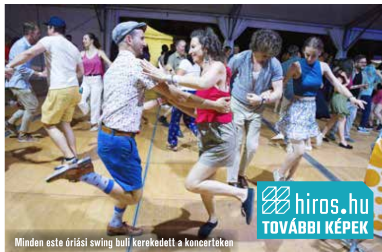
Minden este óriási swing bull kerekedett a koncerteken

Négy nap alatt öt színpadon a műfaj igazi nagygúyit hallhattuk, láthattuk. A fesztivál egyik kedvence volt a Hollandiából érkező