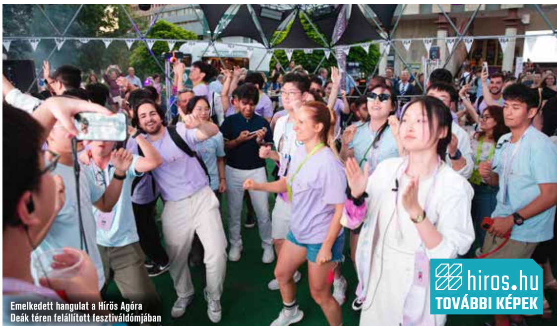
Emelkedett hangulat a Hírös Agóra Deák téren felállított fesztiváldómjában